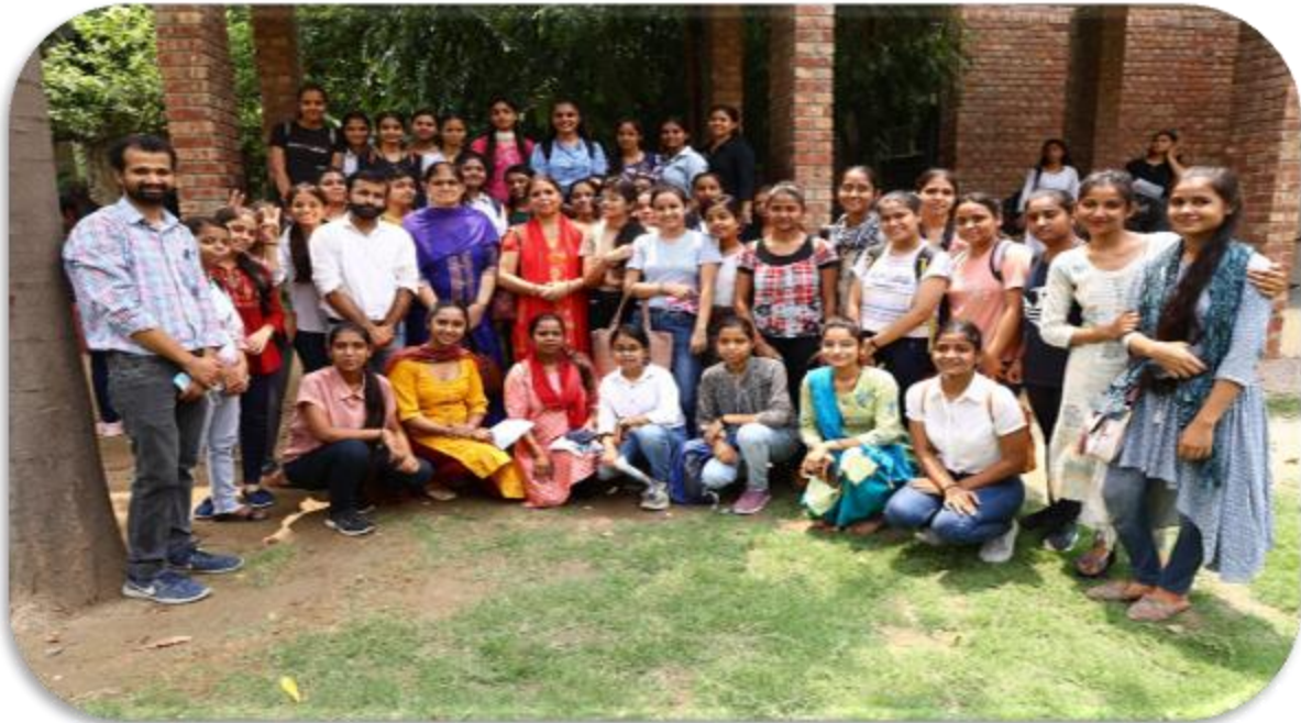
BA Program III YEAR 2022