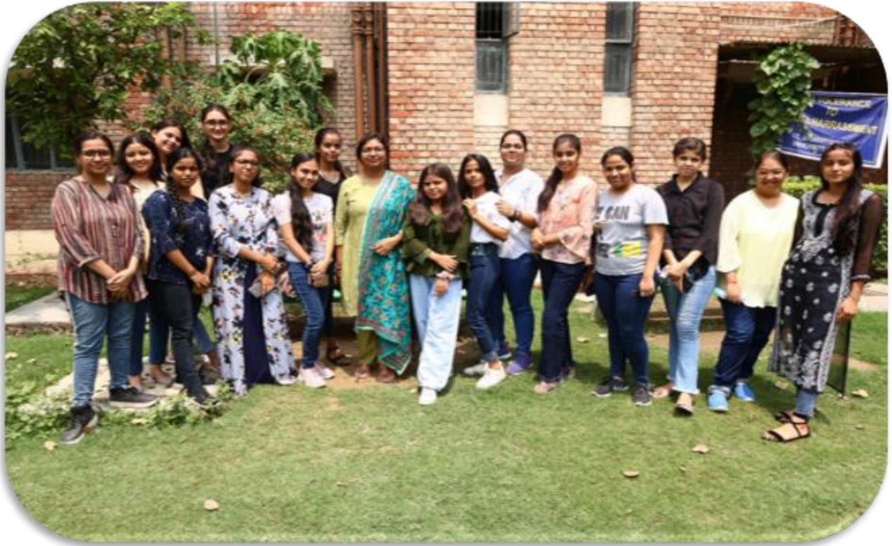
BA PROGRAM II YEAR 2022