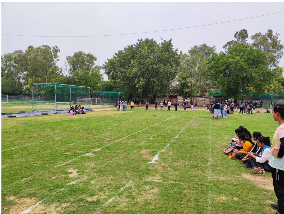
100 m Racing Event