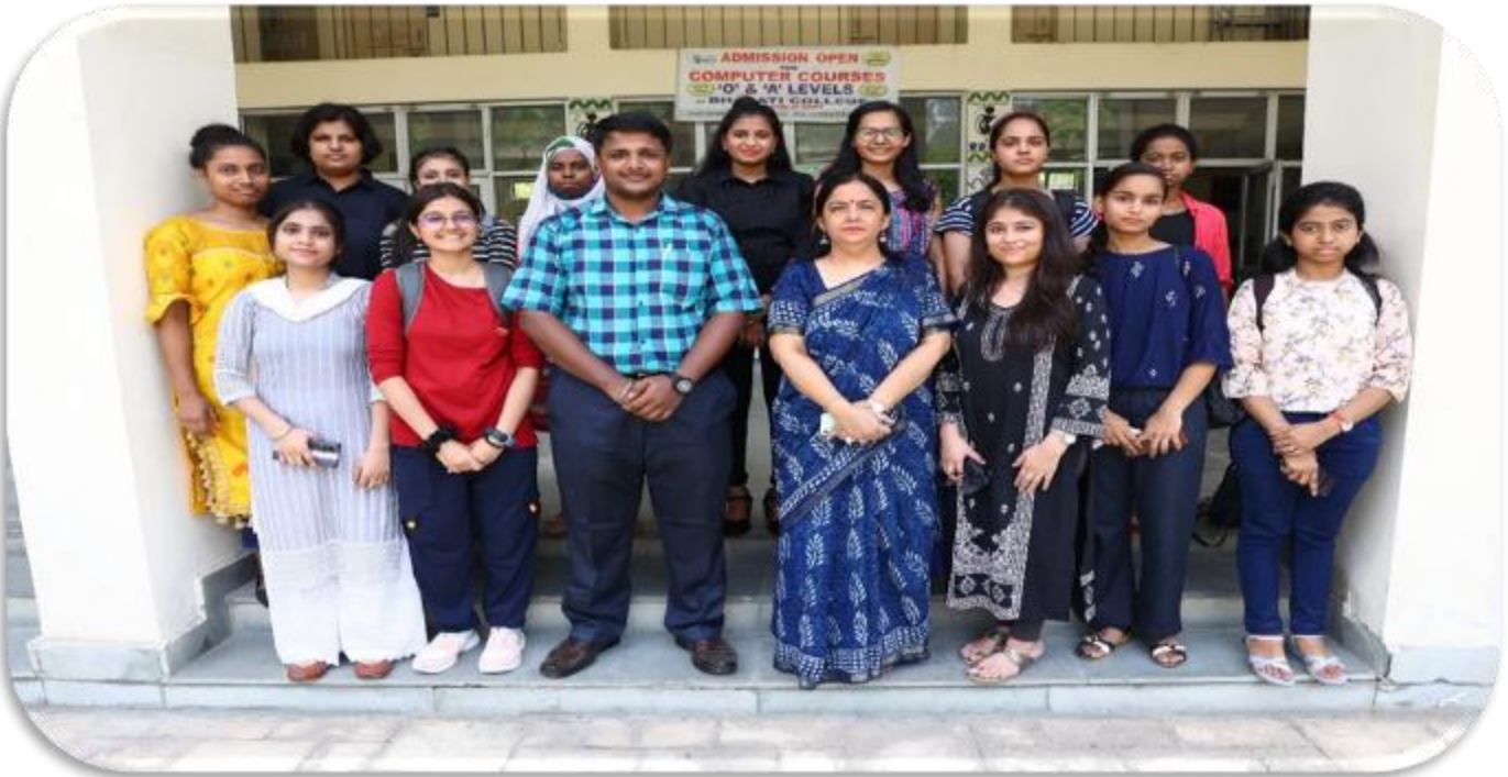
B. Com I Year 2022