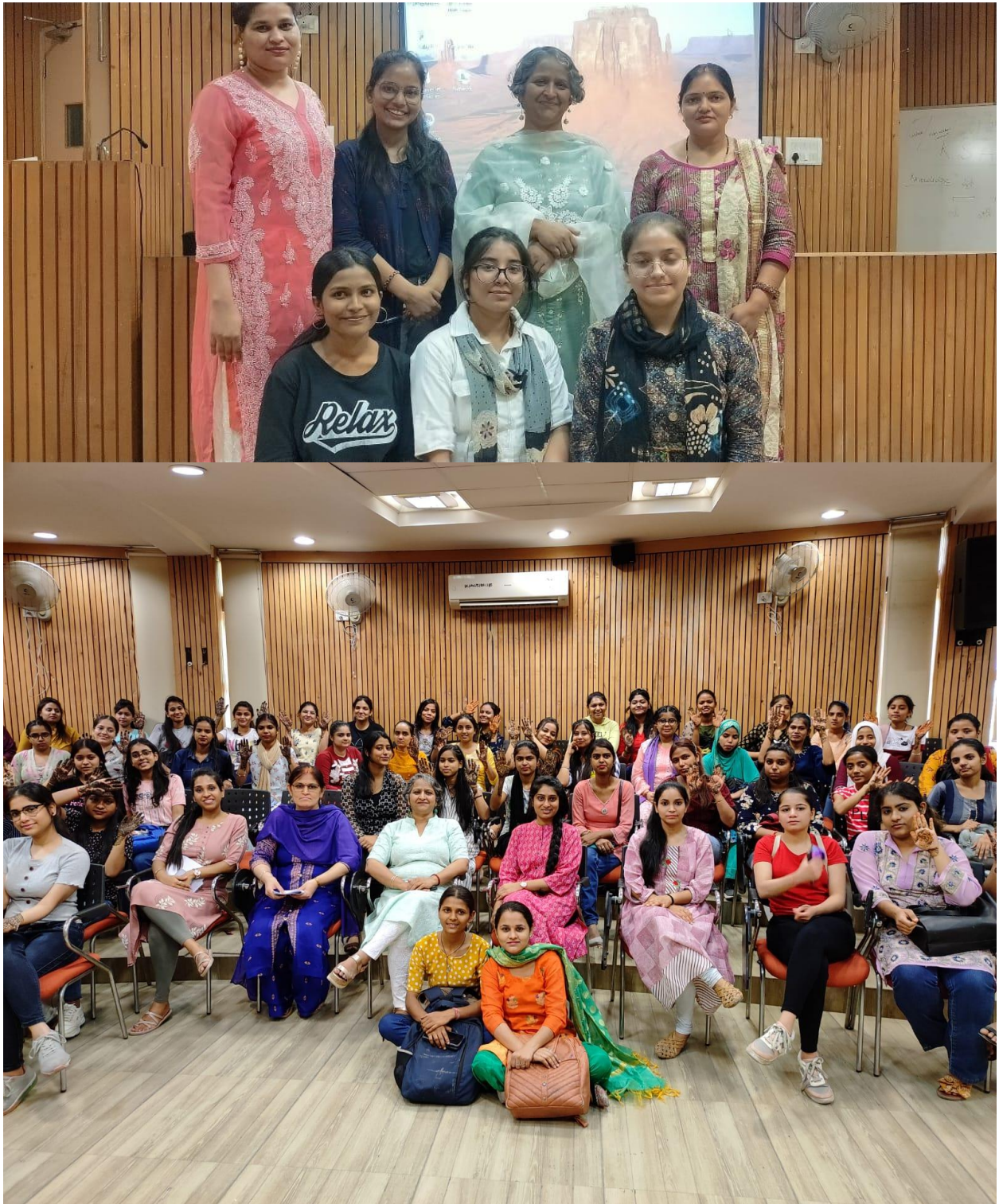
Participants with Faculty and TIC